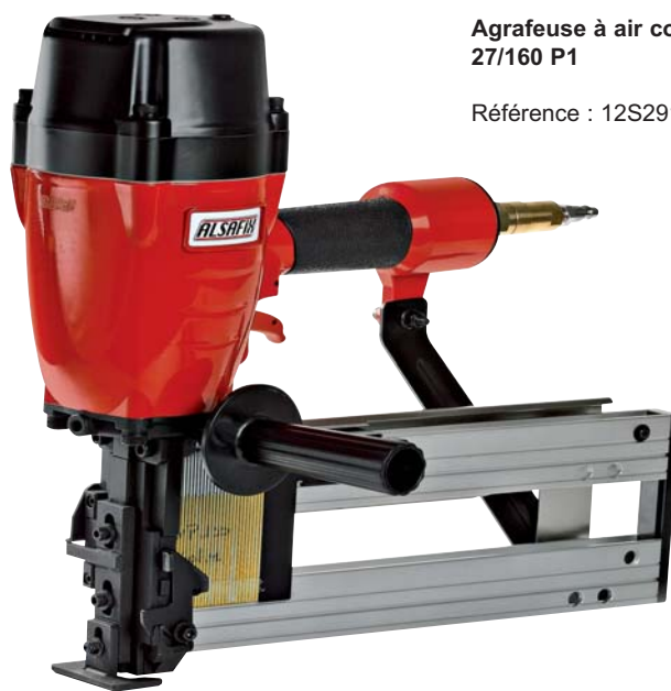
Agrafeuse à air comprimé 27/160 P1

Agrafeuse à air comprimé ALSAFIX 27/160 P1 - la fixation adaptée haute sécurité des panneaux isolants en fibres AGEPAN THD.