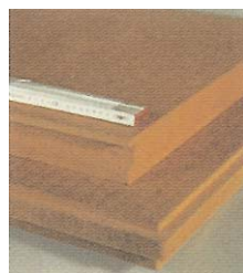
AGEPAN THD - de nos jours, même des panneaux isolants en fibres épais peuvent être fabriqués en un processus de production à un seul cycle.