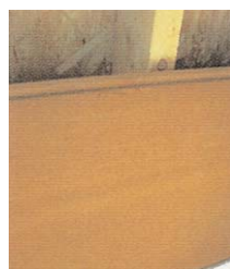
AGEPAN THD - le revêtement extérieur diffusant et permettant de diminuer les ponts thermiques.