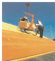
AGEPAN THD - le calorifugeage résistant aux perforations (à partir de 60 mm), idéal en tant que panneau d'isolation sur chevrons.