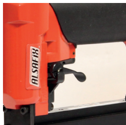
Réglage de cadence de tir