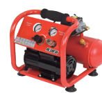
Compresseur ALAIR 4/40 Oiless Code : AL57155