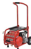
Compresseur ALAIR 20/255 Code : AL57170