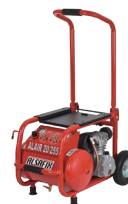
Compresseur ALAIR 20/255 Code : AL57170