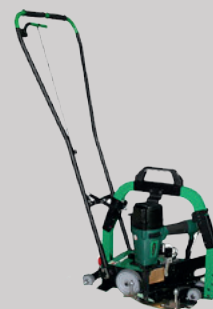
Dispositif de travail debout en option.